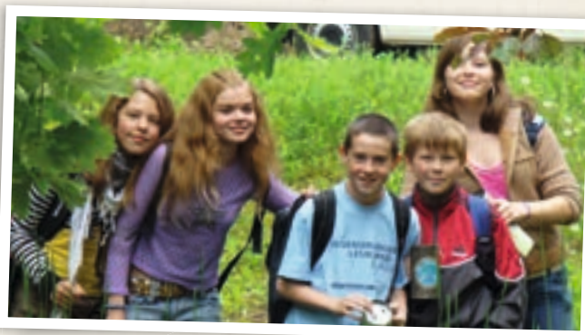
Gemeinsam Sammeln fördert das Zusammengehörigkeitsgefühl.

Das alles ist nur möglich, weil so viele Menschen den BN mit ihrer Mitgliedschaft, Spende oder aktiven Mitarbeit unterstützen .