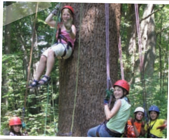
Mit ihrer Dankeschön-Sonderprämie machten Münchener Schülerinnen einen Ausflug ins BN Naturschutz- und Jugendzentrum Wartaweil.

Die Schüler/innen übernehmen Verantwortung für Spenden, die ihnen andere anvertraut haben. Das stärkt ihr Selbstbewusstsein und erfüllt mit Stolz. Die Fähigkeit Verantwortung für sich und andere übernehmen zu können, gehört zu den Kernkompetenzen des Lebens.